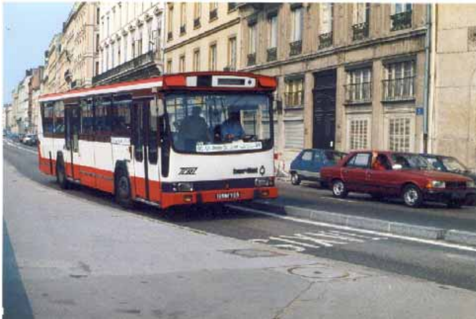
PR100PA numéro 2742 vu quai Maréchal Joffre en juillet 1985

Son exploitation fut interrompue en septembre 1986 puis repris en mars 1987 avant d'être définitivement supprimée en janvier 1988.