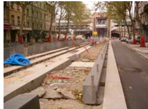
Construction de la station « SUCHET »