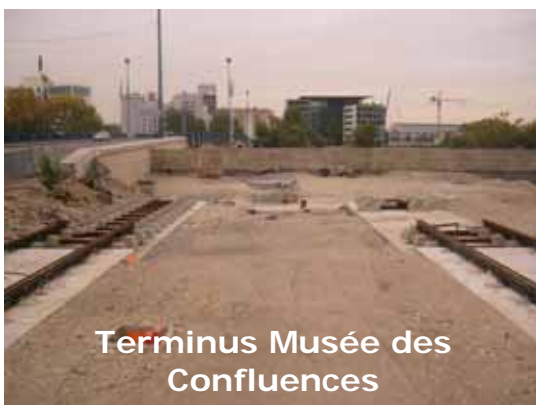
Terminus Musée des Confluences