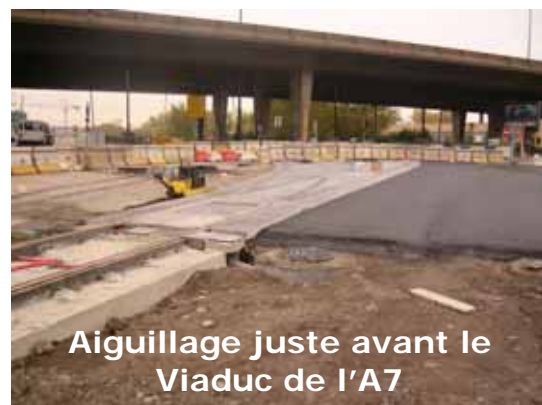
Aiguillage juste avant le Viaduc de l'A7