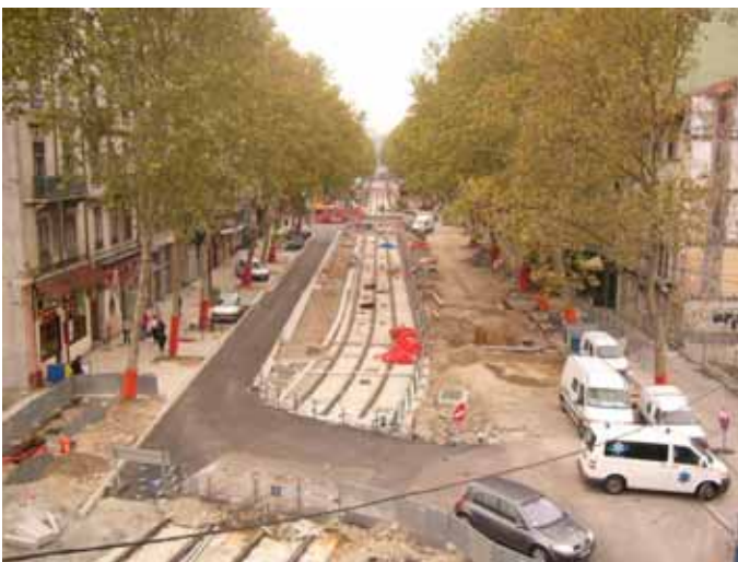
Vue d'ensemble : La circulation a été reportée coté Est pour la construction de la station Suchet.