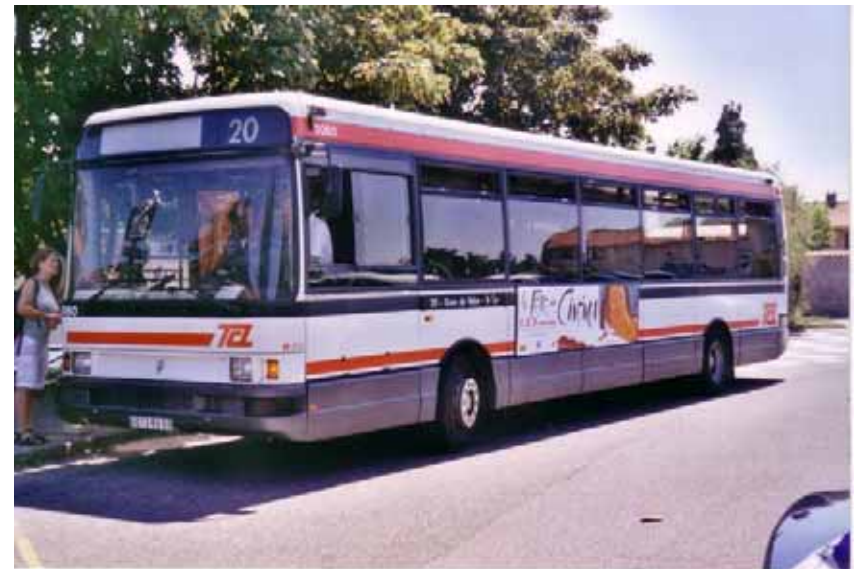
R312 sur la ligne 20 au Mont Cindre