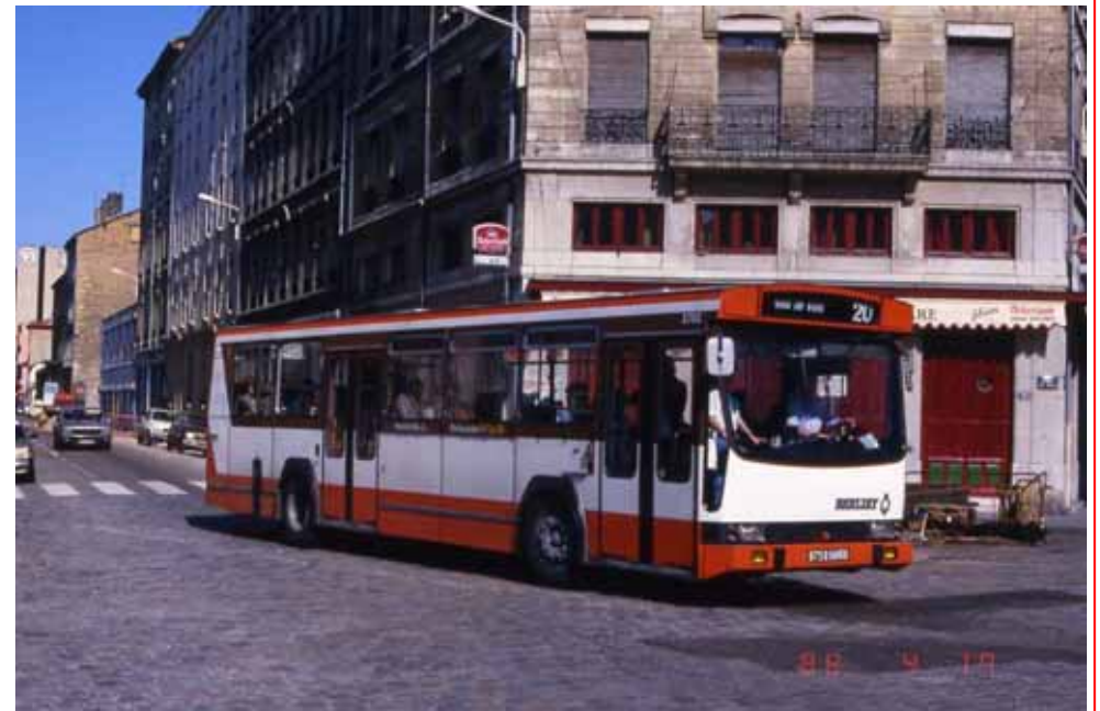
Ligne 20, le 17/04/1988