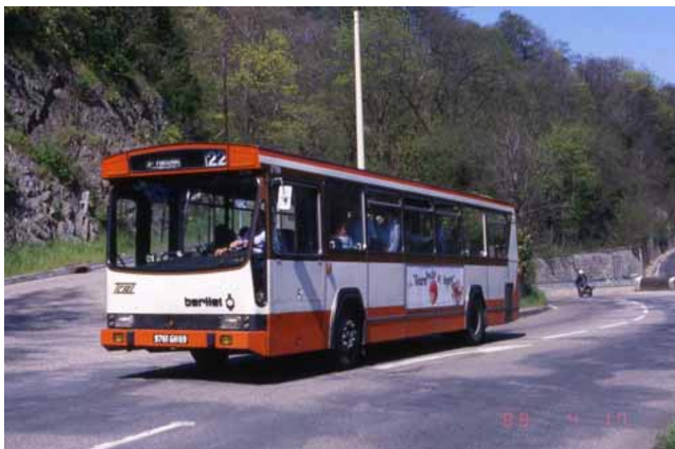
1988 - le PR100 2794 près de la Bifurcation du Val Rosay sur la ligne 22 à destination de « St Fortunat »