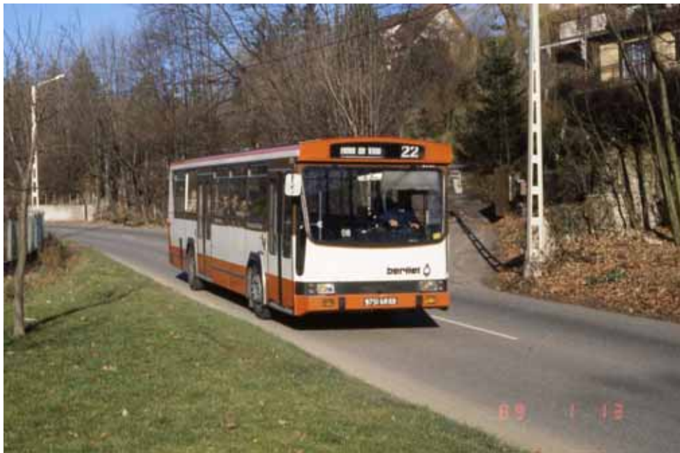
Ligne 22, le 13/01/1989