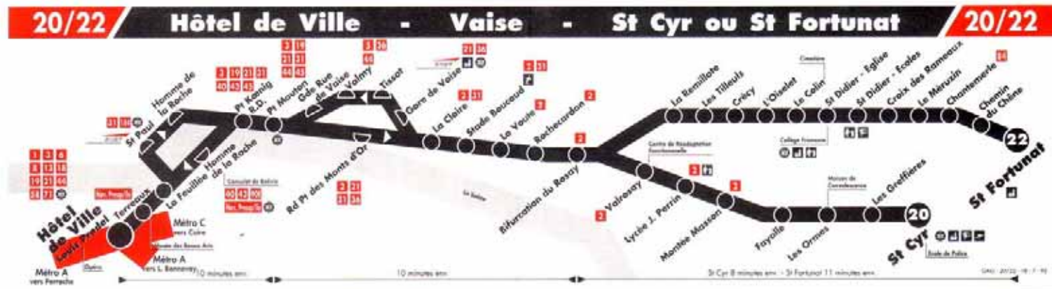
Ancien plan de ligne