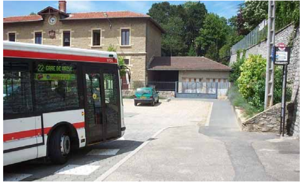
Agora Line de la ligne 22 au terminus de St Fortunat.