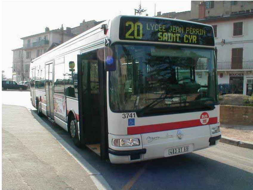
Agora Line de la ligne 20 au terminus de St Cyr au Monts d'Or.

En 2005, nos 2 lignes 20 et 22 sont toujours sur les traces de leurs ancêtres, sur les routes tortueuses du Mont d'or. Leur fonctionnement est jumelé au dépôt de St Simon (Vaise), et c'est encore plus visible la nuit, lorsqu'un service spécial en boucle appelé « 20/22 » effectue le trajet intégral des 2 lignes.