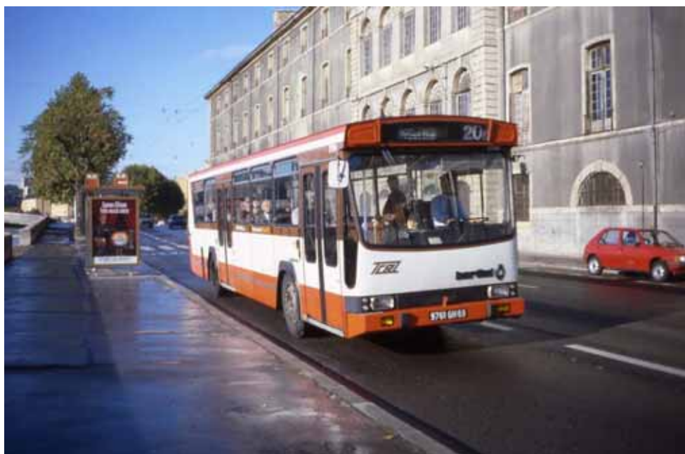
1988 - le PR100 2794 Quai St Vincent sur la ligne 20 à destination de « Hôtel de Ville »