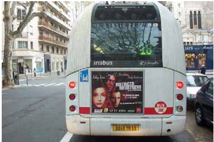
Le couloir à contre-sens de la ligne 18 Avenue de Saxe