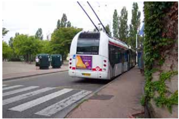
Terminus Montessuy Gutenberg