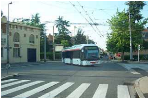
Cuire : sortie de dépôt d'un 13