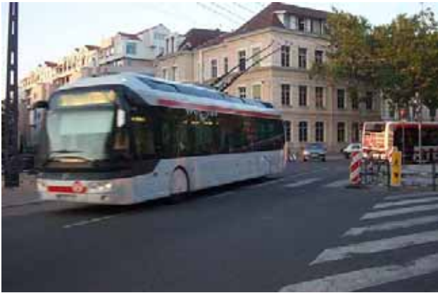
Passage à Croix-Rousse direction Montessuy

Arrivée à l'ancien Fort de Montessuy, en compagnie de la ligne 8 qui fait également terminus ici.