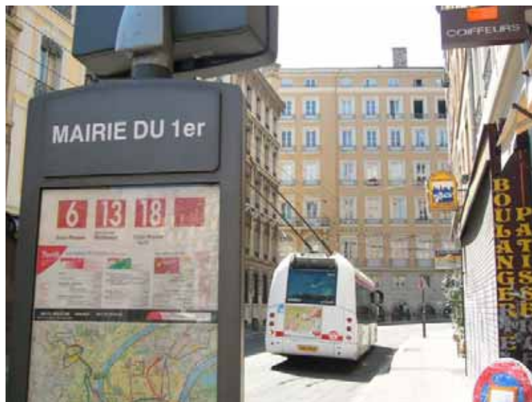
L'arrêt Mairie du 1 er en direction de Montessuy / Croix Rousse Nord.