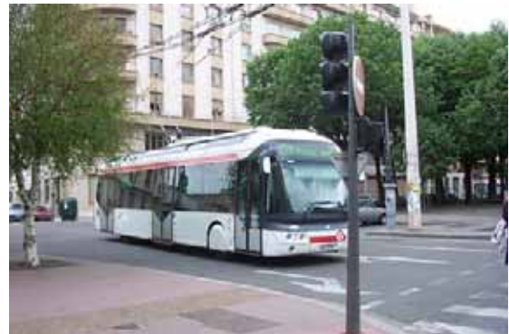
Ci-contre : ligne 18 à Jean Macé

On redescend brutalement dans la fournaise du centre rive gauche, Place Jean Macé. Cette place chère aux amateurs de lignes aériennes (lignes T2, 4, 11 et 18) accueille donc le terminus Méridional de la ligne 18, qui vient se poser juste derrière la 4 près de l'accès Ouest du métro B.