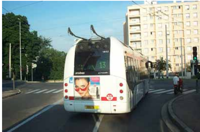
Un 13 va à Montessuy en autonomie