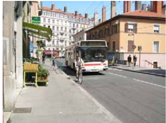
13 exploitée en Agora à l'arrêt "Mairie du 1er"