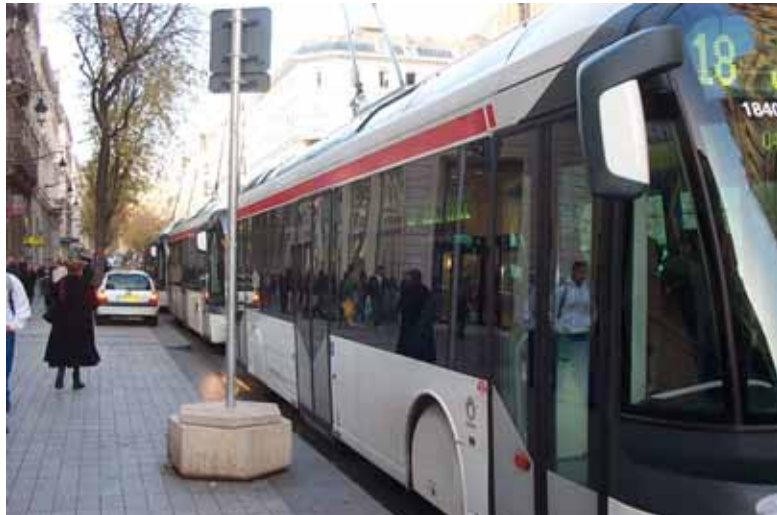
Alignement de 18 et de 1 rue de la République