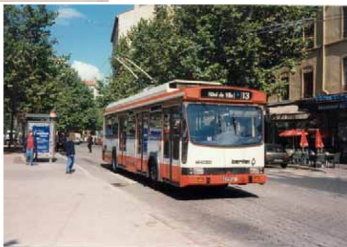
Le Mag n°26 – Juillet 2005