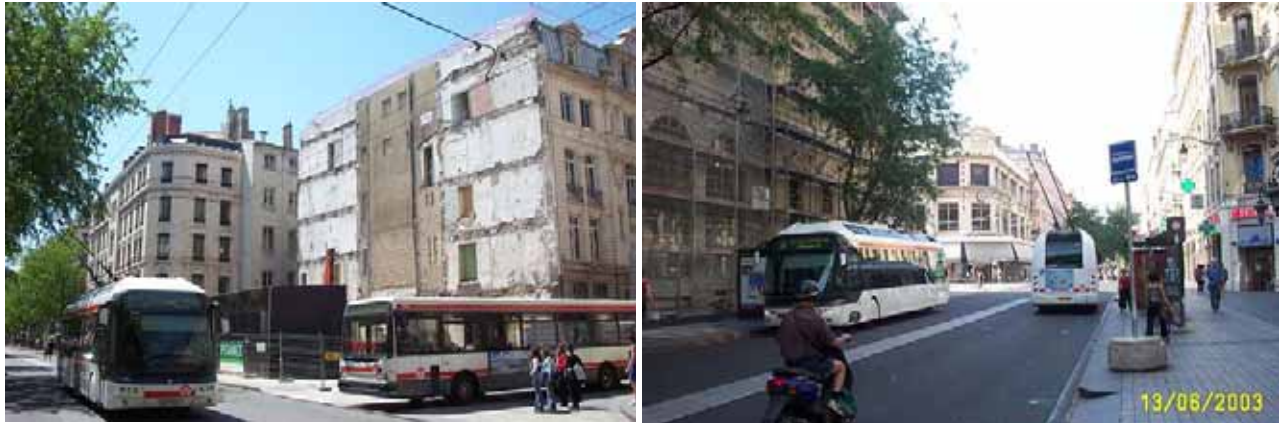
La ligne 18 sur la rue de la république ( Lyon 2ème)