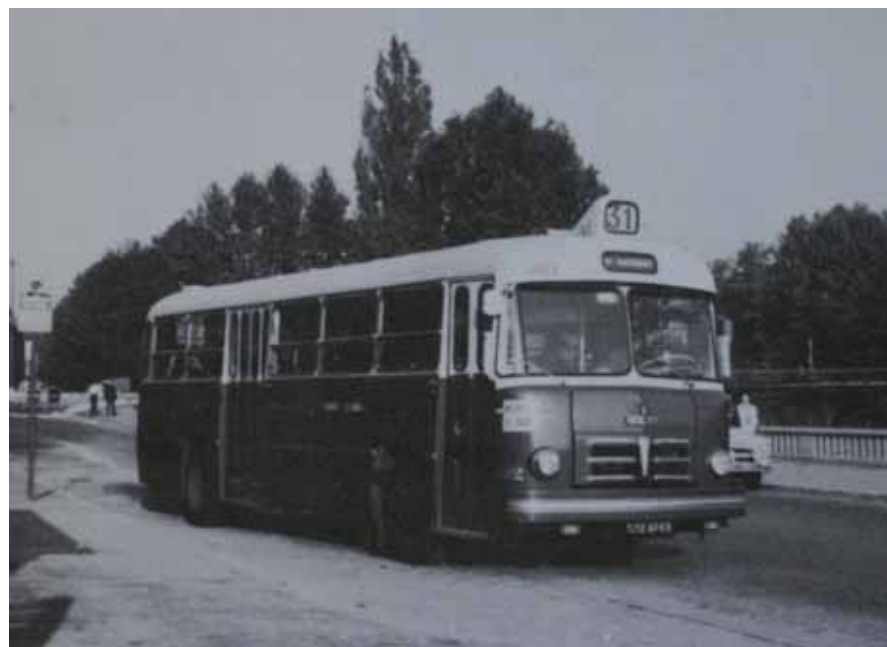
Autobus PLR n°1802