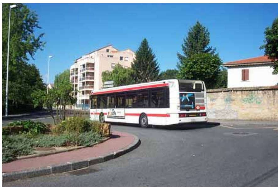
Le terminus « Plateaux de St Rambert »