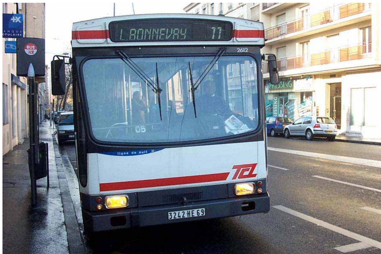
Un ER100 sur la ligne 11 à l'arrêt "Maisons Neuves" (Décembre 2003)