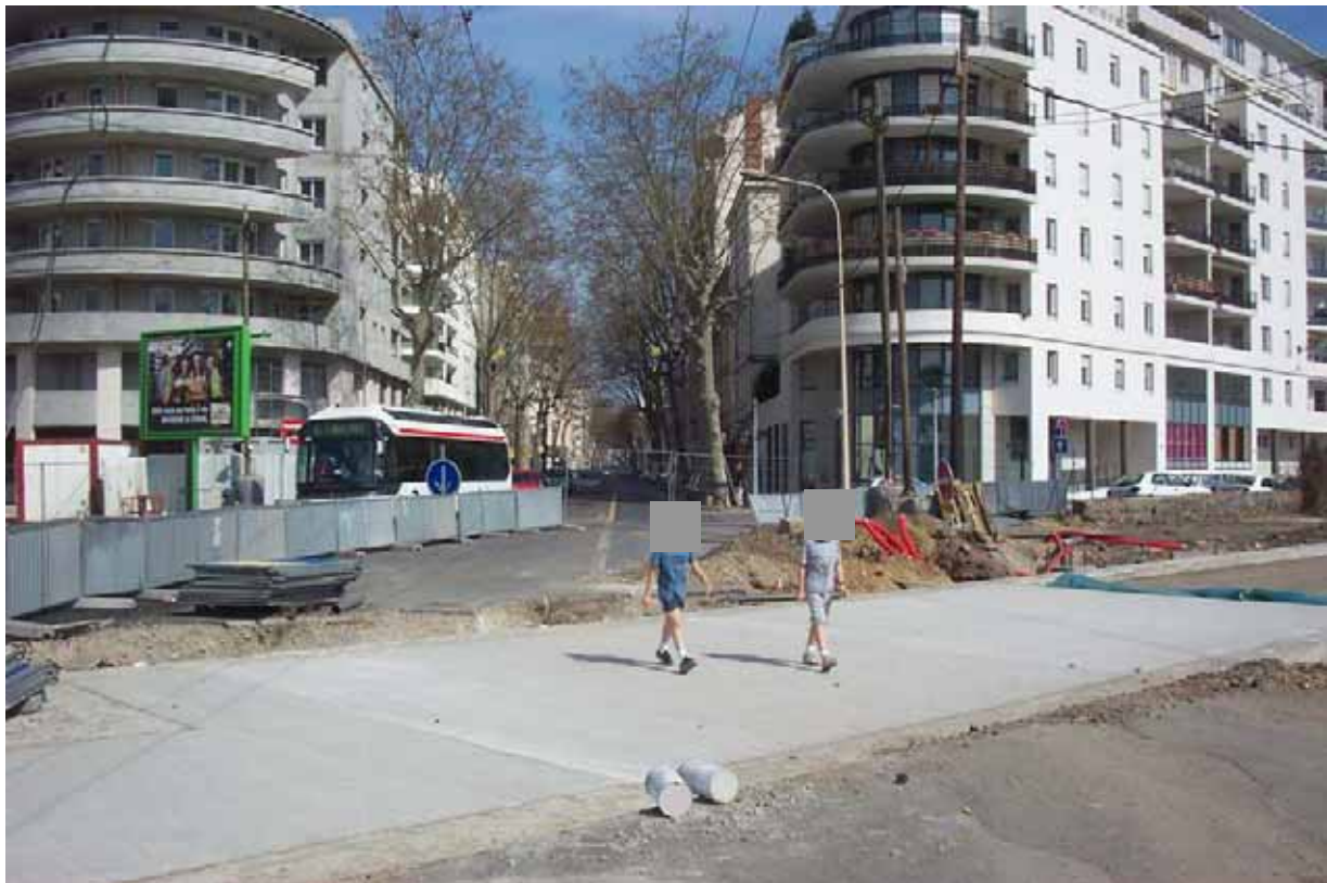
Au premier plan, la plateforme de la future 3 ème ligne de tramway de l'agglomération lyonnaise.

Le passage se fait donc obligatoirement perches au toit.