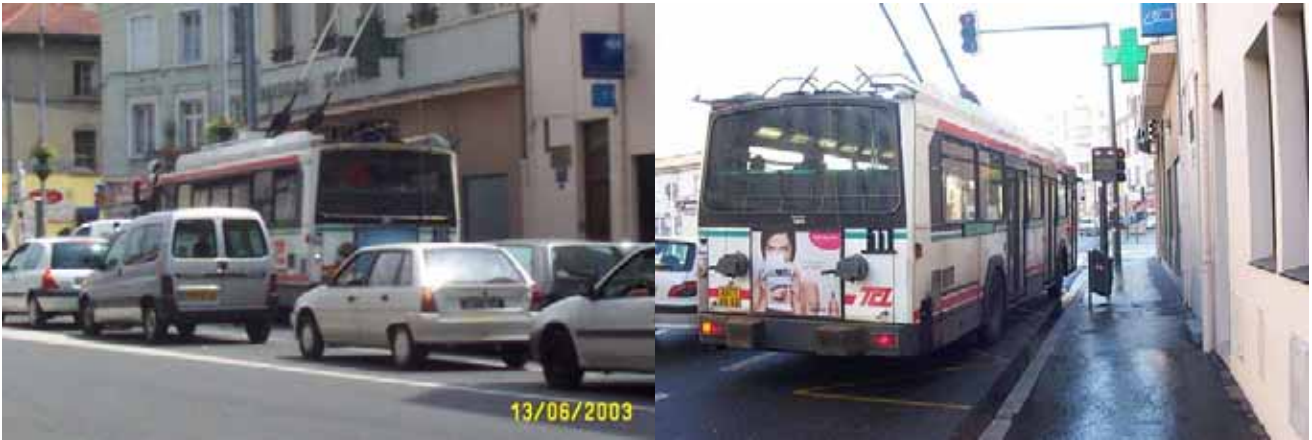
A l'arrêt "Maisons Neuves", la ligne 11 est fréquemment engluée dans la circulation : à droite, une photo insolite, le bus peut faire l'arrêt presque contre le trottoir car aucune voiture n'est en double file, chose rarissime

Une fois extirpés de cet amas de véhicules, il faut désormais dépercher, car les travaux de LEA progressant à vive allure, la pose des rails au niveau de la Gare de l'Est oblige le Cristalis à se déporter au nord.