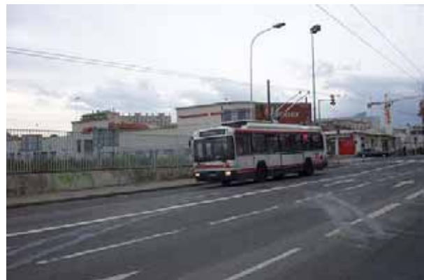
ER100 venant de croiser le Bld V. Merle en direction de L. Bonnevey

La ligne 11, c'est une ligne qui reste peu rapide étant donné sa faible part de site propre.