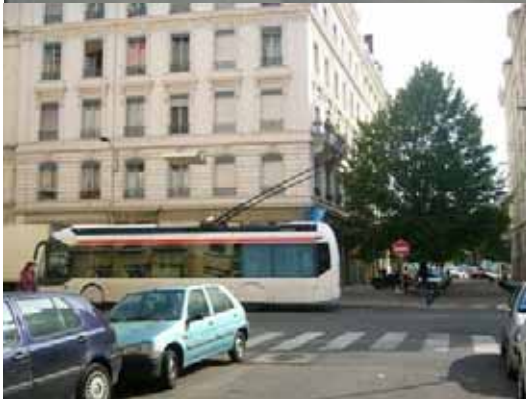
La Place Jean Macé et le métro B est juste derrière le grand arbre, à quelques pas...