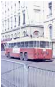
VA3B2 739 le 23 mars 1969