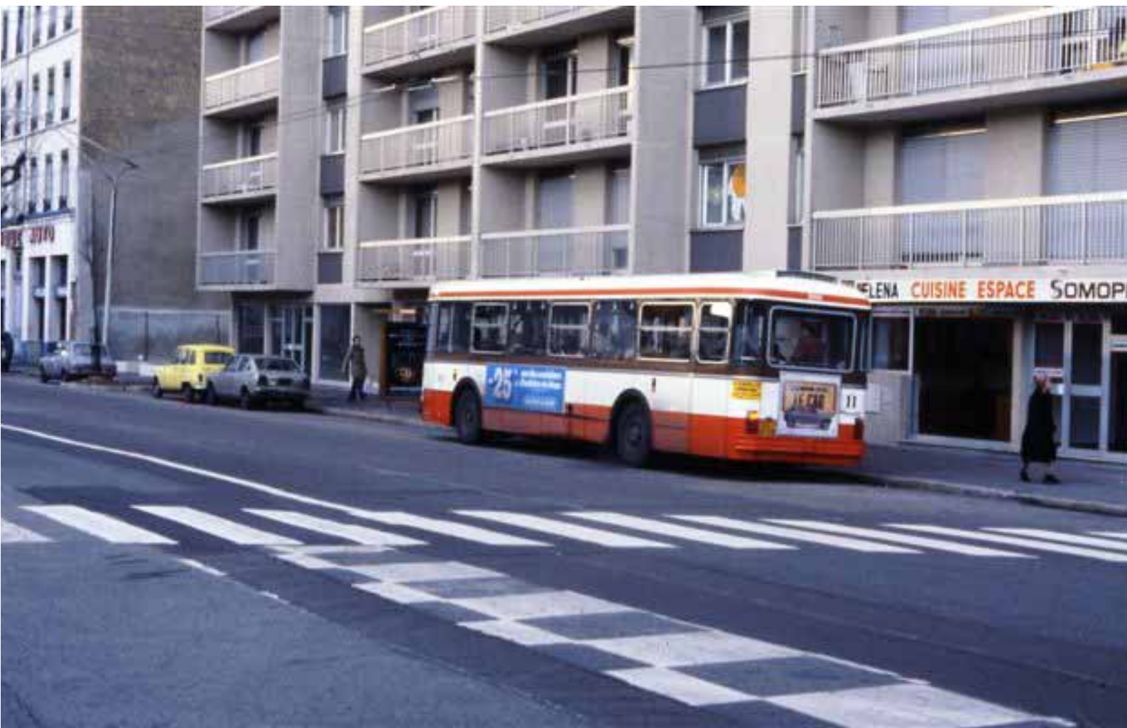
SC10 3400 Avenue Felix Faure – Novembre 1979