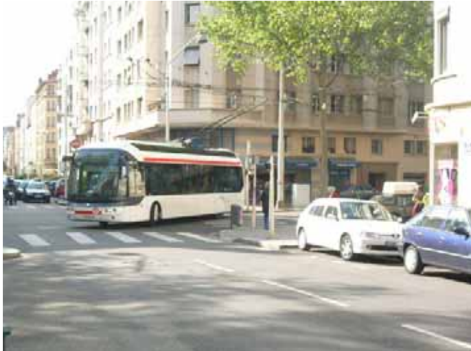
Après avoir pris son aiguillage qui le sépare alors des lignes 4 et 18, le Cristalis tourne à gauche dans la rue Chevreul depuis l'avenue Jean Jaurès.

Les bus de la 11 peuvent alors se reposer (et aussi les conducteurs qui l'ont bien mérité) à l'angle Chevreul/Domer.