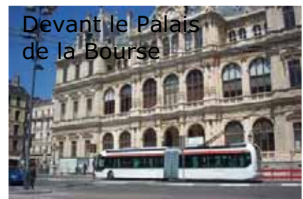
Devant le Palais de la Bourse