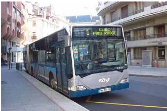
TAG (Grenoble, 38) Mercedes MB Citaro 0530 G