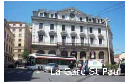
La Gare St Paul