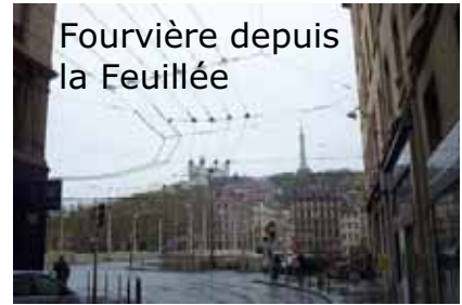
Fourvière depuis la Feuillée