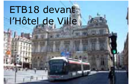
ETB18 devant l'Hôtel de Ville