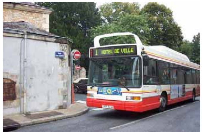
Vitalis (Poitiers, 86) Heuliez GX 317 GNV