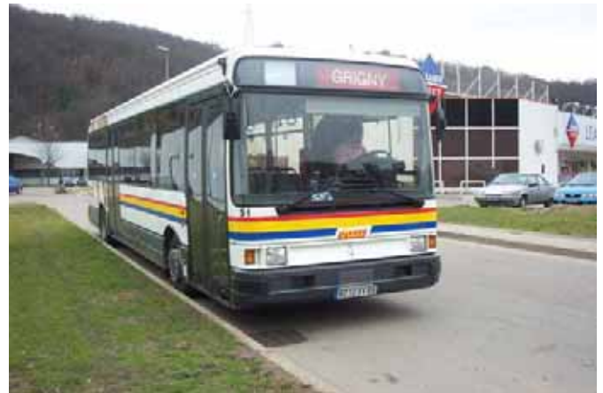
Gibus (Givors, 69) Renault R312