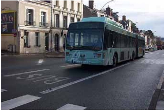
Fil Bleu (Tours, 37) Van Hool AG 330