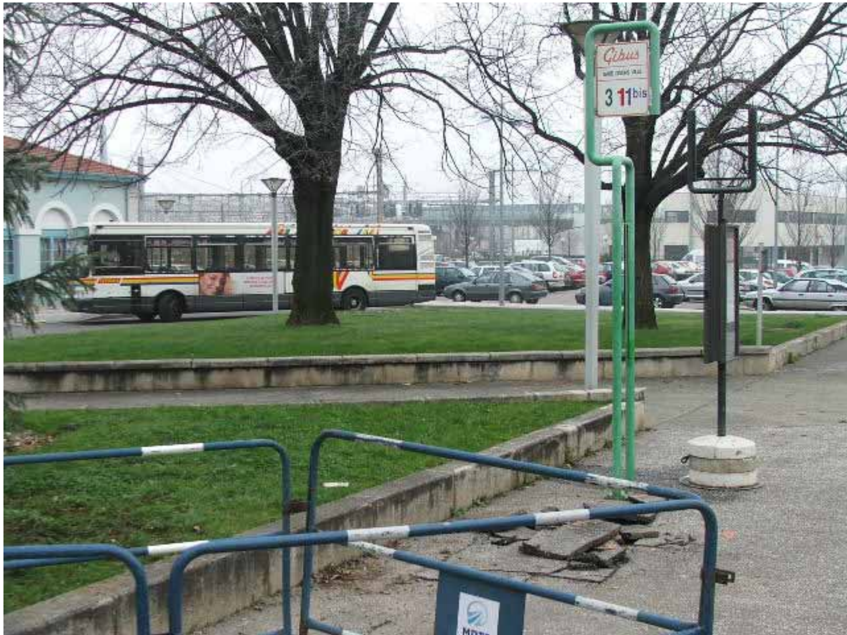
Devant la gare de Givors Ville, un poteau provisoire TCL a été mis en place pour remplacer le poteau Gibus, qui sera prochainement démonté. Au premier plan, les travaux d'implantation du futur abribus JC Decaux ont déjà commencé.