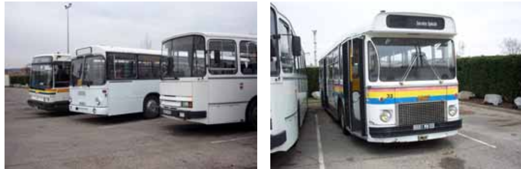
Image insolite : les anciens autobus Gibus, encore en circulation jusqu'au 31 décembre au soir côtoient les bus plus récents des TCL fraîchement débarqués. Seul l'Agora Gibus fait bonne figure au milieu des R312.

Alors qu'il y a si peu de temps, le dépôt Gibus renfermait un vieux SC10, et quelques autocars de la société des cars Roannais, les premiers bus TCL sont désormais visibles. Ils sont utilisés pour la formation des conducteurs (conduite, girouettes, etc...)