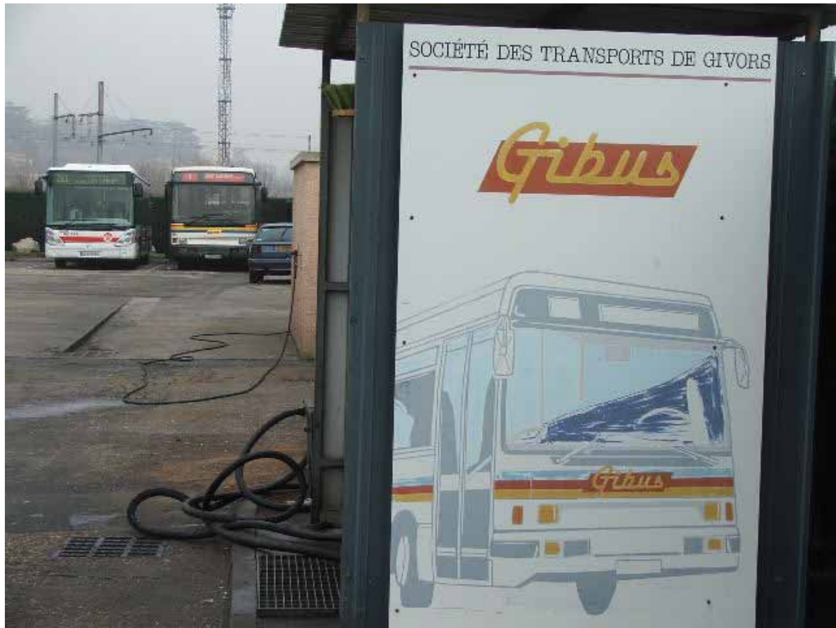
Un vieux panneau qui pourra entrer au musée des transports de Givors.